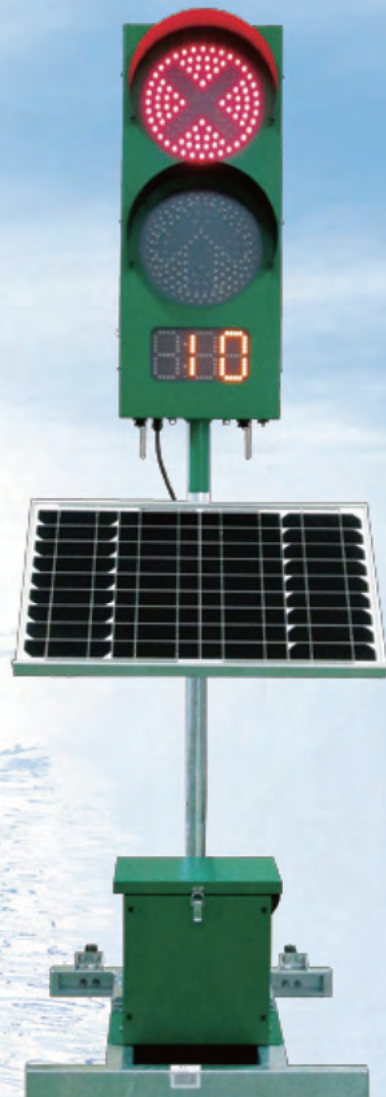
【おすすめ】 大型ソーラーパネル 大型バッテリー仕様 型式/CGS225CS3

従来機にプラス機能 ①4差路対応可能 ②無線リモコン等の外部機器後付けオプションが接続可能。